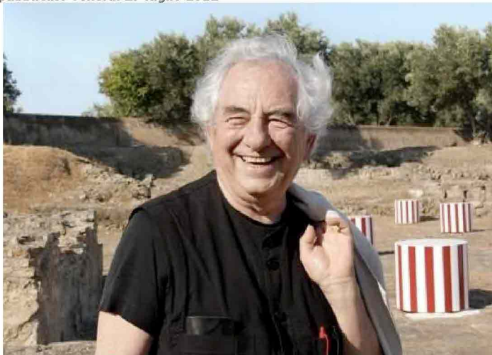
Daniel Buren, per Intersezioni 7 , Parco di Scolacium, Catanzaro