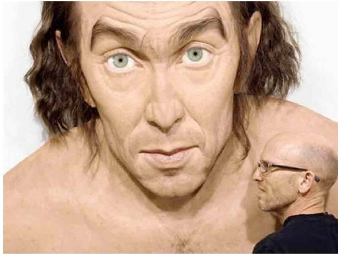
Una delle opere in mostra

Nelle sale del museo si passa da un effetto all'altro, senza trovare una risposta definitiva, perché, come ricorda lo stesso Evan Penny : « Il mio fine non vuole essere quello di giudicare, ma di cogliere i processi del continuo flusso di immagini ». Le sue opere emergono come un insieme calibrato di potenza scultorea e autenticità fotografica, alla ricerca di punti di equilibrio tra immagine bidimensionale e spazio tridimensionale. L'artista confronta due mondi, la percezione che abbiamo di noi stessi e degli altri legata a spazio e tempo, e quella che invece deriva da un'immagine. Il viaggio nella costruzione della visione, così, comincia con Aerial #2 : un gigantesco uomo di oltre due metri, perfetto nei particolari minuziosi di pelle, capelli, peli, rughe, completamente nudo, capace di esercitare sul suo pubblico un doppio effetto di attrazione e repulsione; l'opera fa parte della serie Stretch e Anamorph , esempi di manipolazioni fatte in postproduzione per video e foto, oppure esempi della visione da posizioni particolari.